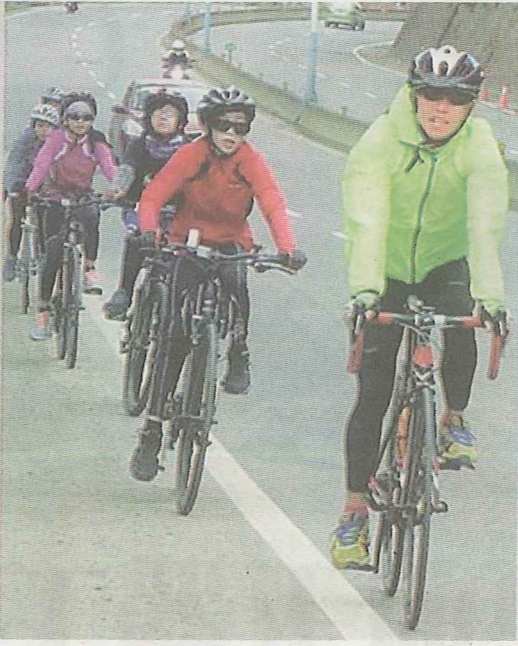
▶大坪國小畢業生計畫挑戰三日騎兩百公里的單車行程，學生利用假日團騎加強體能。