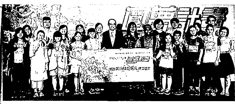
2017圓夢計畫成果展贈百萬圓夢金子13所小學

徵件日期： 即日起至10月21日(六) (以郵戳為憑) 徵件辦法： 詳見活動網站 網址： http://118.163.96.192/dreammaker