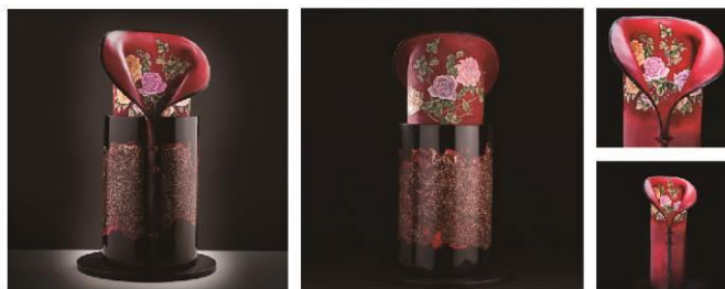
In the exhibition, more than 50 pieces of recent works by the artist are displayed, including "Lady Zhen". 2018 A' Design Award winner in the Arts, Crafts and Ready-Made Design Category.

本展覽展出50多件馮斯蒂女士近期作品，其中「瑰姿艷逸，儀靜體閑」，是今年度A' 設計大獎 從100個國家、地區，99個不同設計領域的「藝術工藝」類中，由極具國際影響力的知名學者、 媒體、設計人士和企業家組成的評審團，進行評鑑而獲得銅獎的作品。