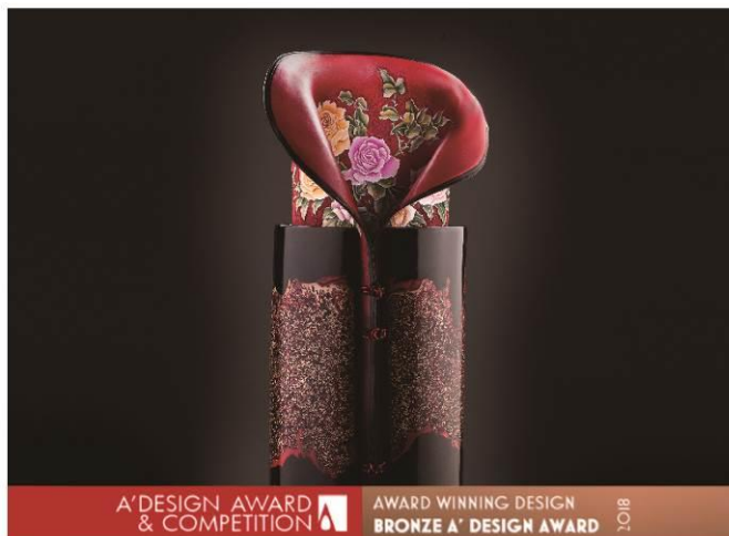
2017-2018 A' 設計大賽「藝術工藝類」銅獎 Bronze A' Design Award Winner In Arts, Crafts and Ready-Made Design Category, 2017-2018