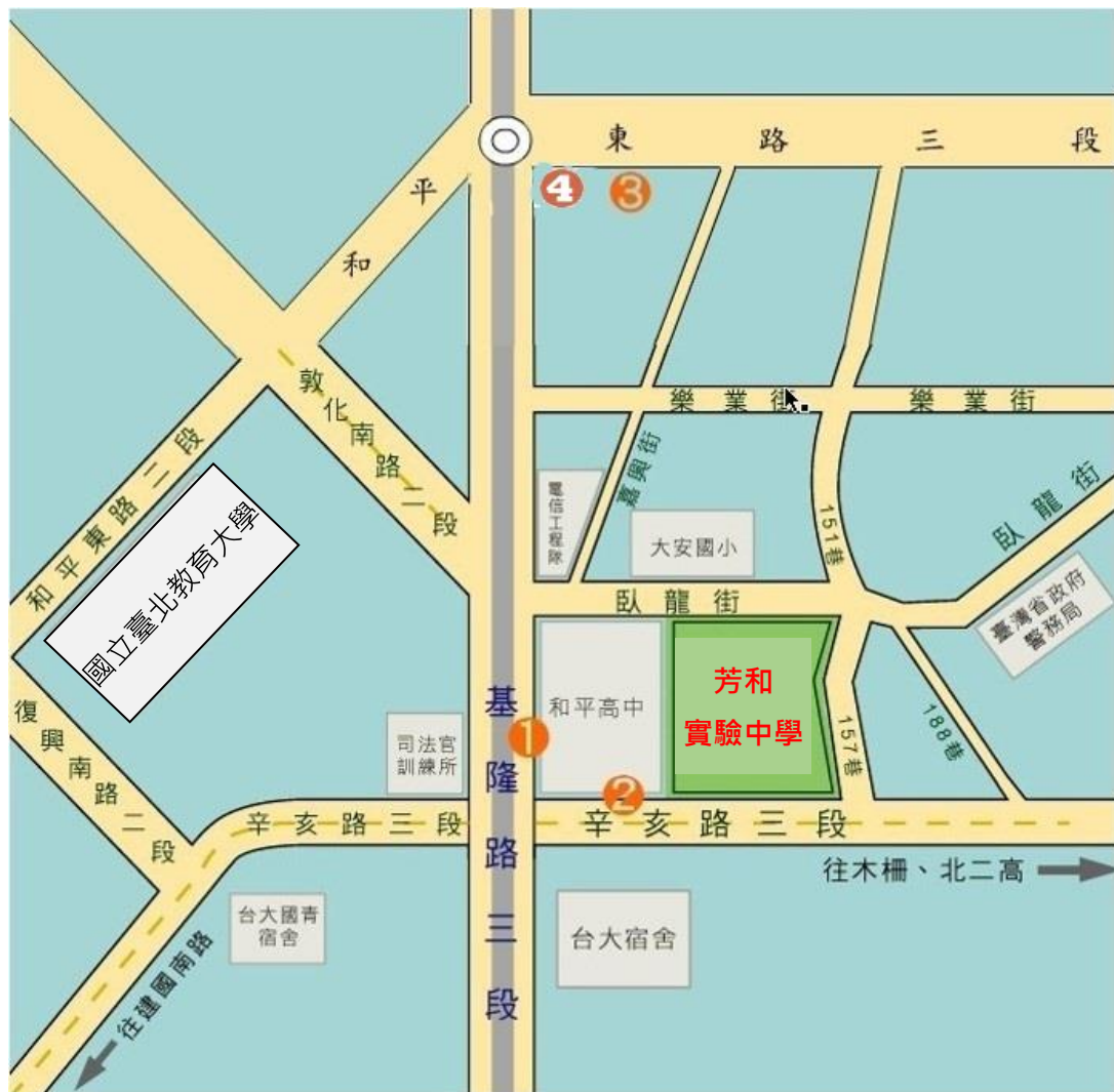
(四)芳和實中交通位置圖