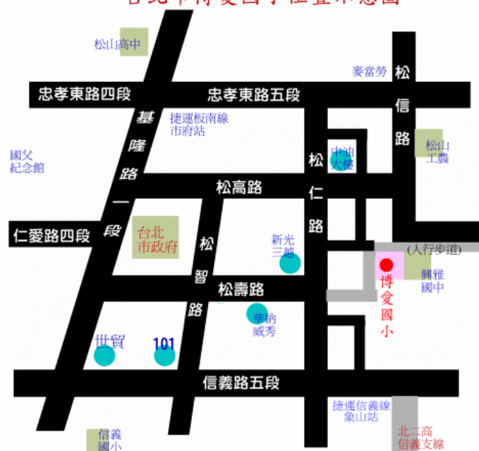
台北市博愛國小位置示意圖